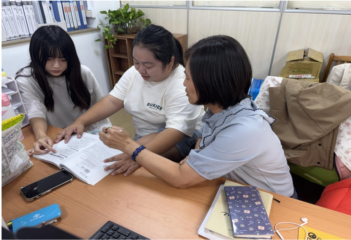
● 進行教保概論輔導