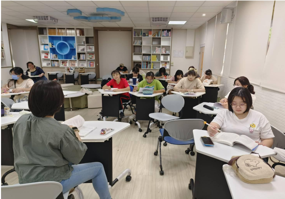
●針對進修部二技幼兒園教保實習之相關法規與實務