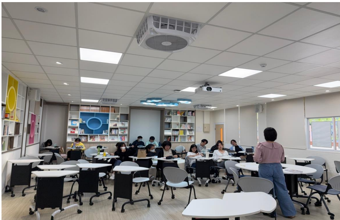
● 輔導幼保1A同學幼兒發展第三章