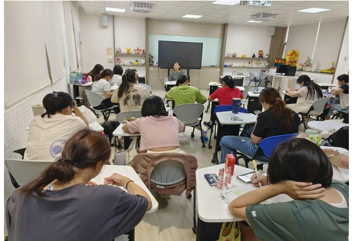
●對進修部二技幼兒園教保實習之相關法規與實務