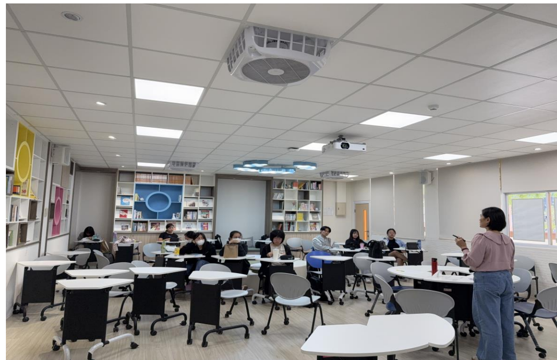
● 大家提出在幼兒動作發展章節不了解之處