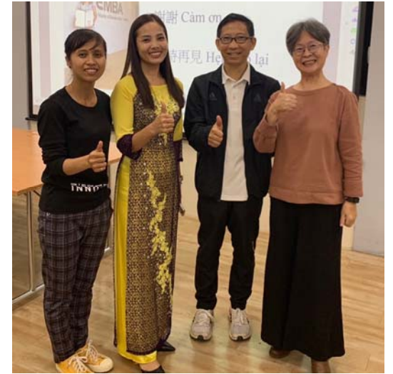
與本校新住民校友合作分享獲選米其林認證的歷程