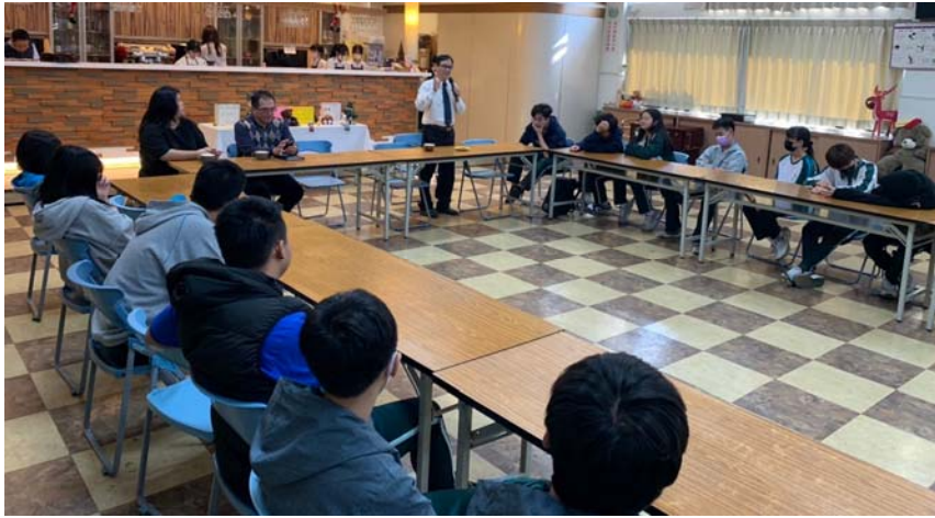
以大手攜小手與在地高中實習咖啡廳交流