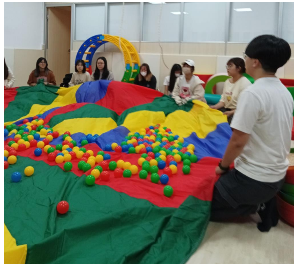
●彩虹傘：大肌肉小肌肉訓練