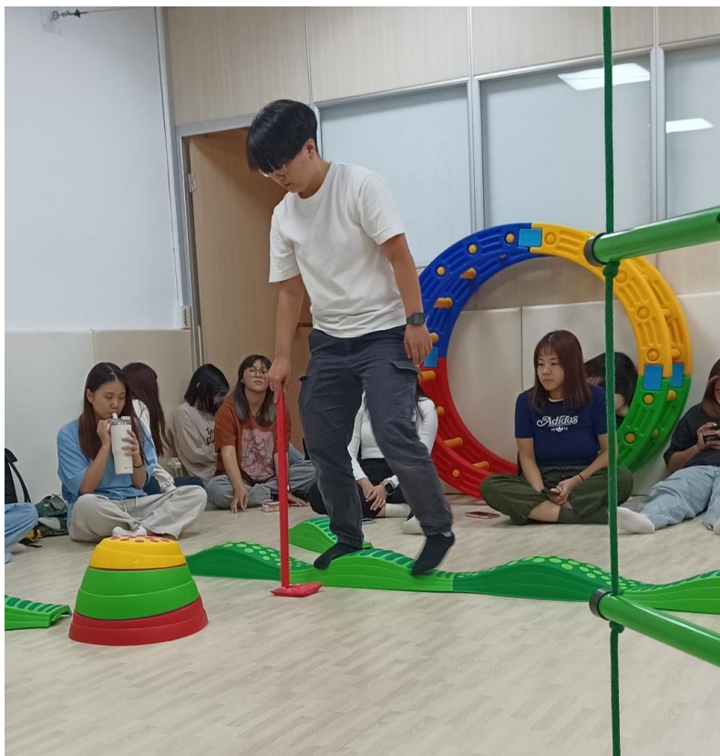
示範：多感官協調訓練