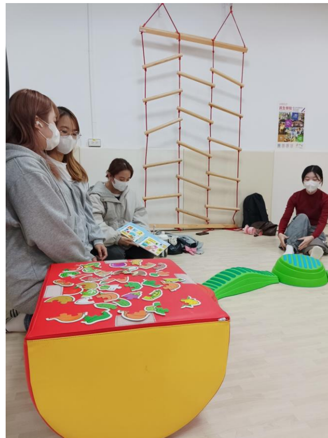
● 期末分享2:前庭覺+本體覺