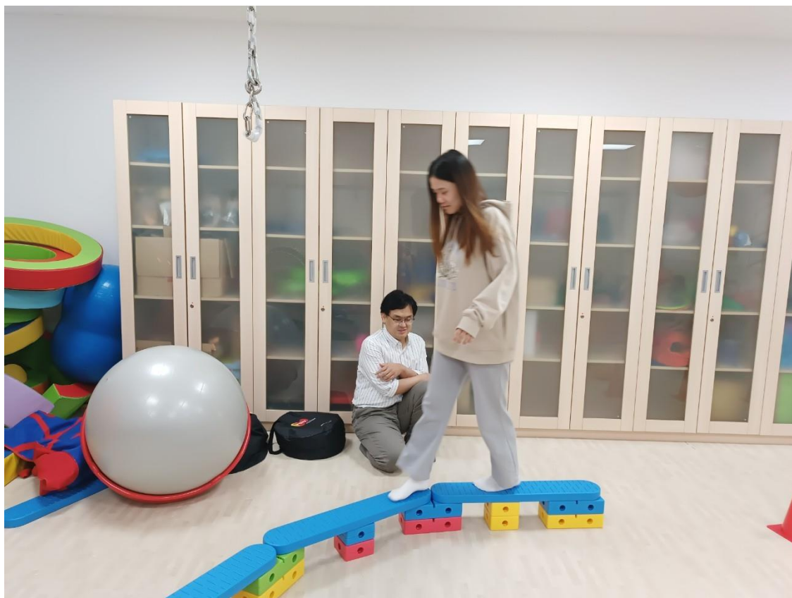
● 期末分享1:繪本結合感統訓練