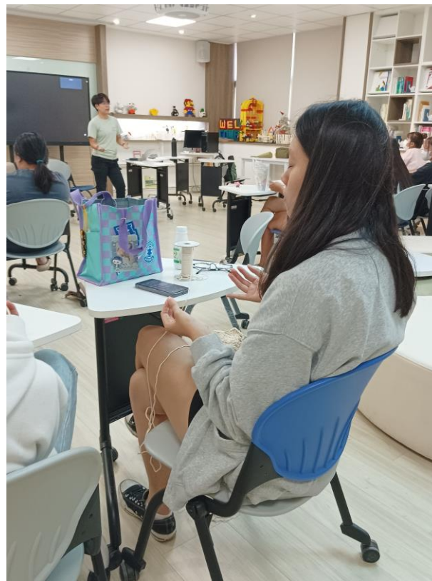
● 心、腦與身體之訓練