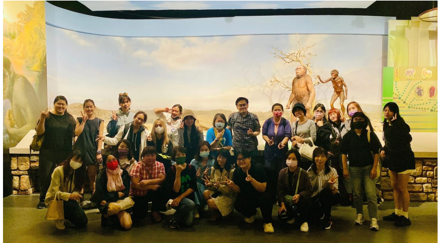
● 與導覽員的全體大合照