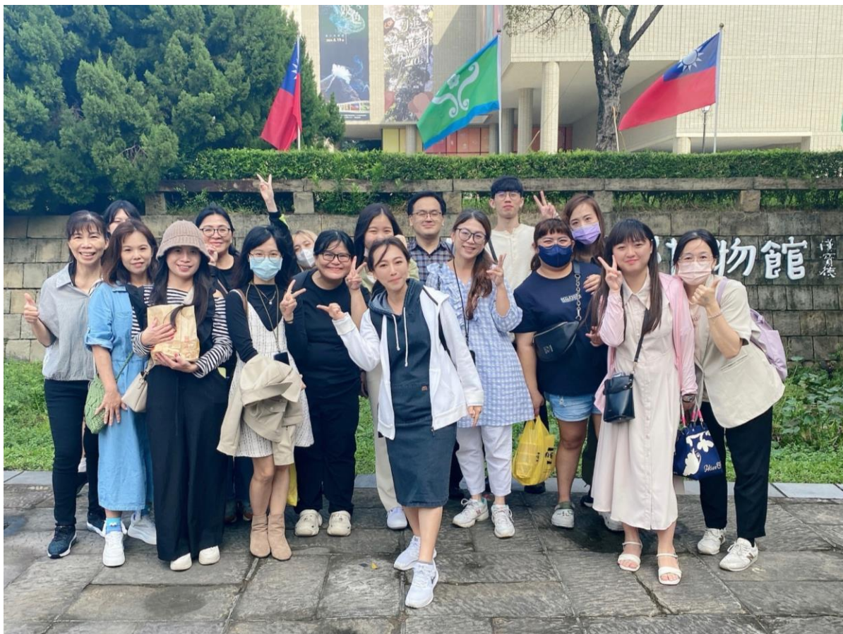
●大門口留影：國立自然科學博物館