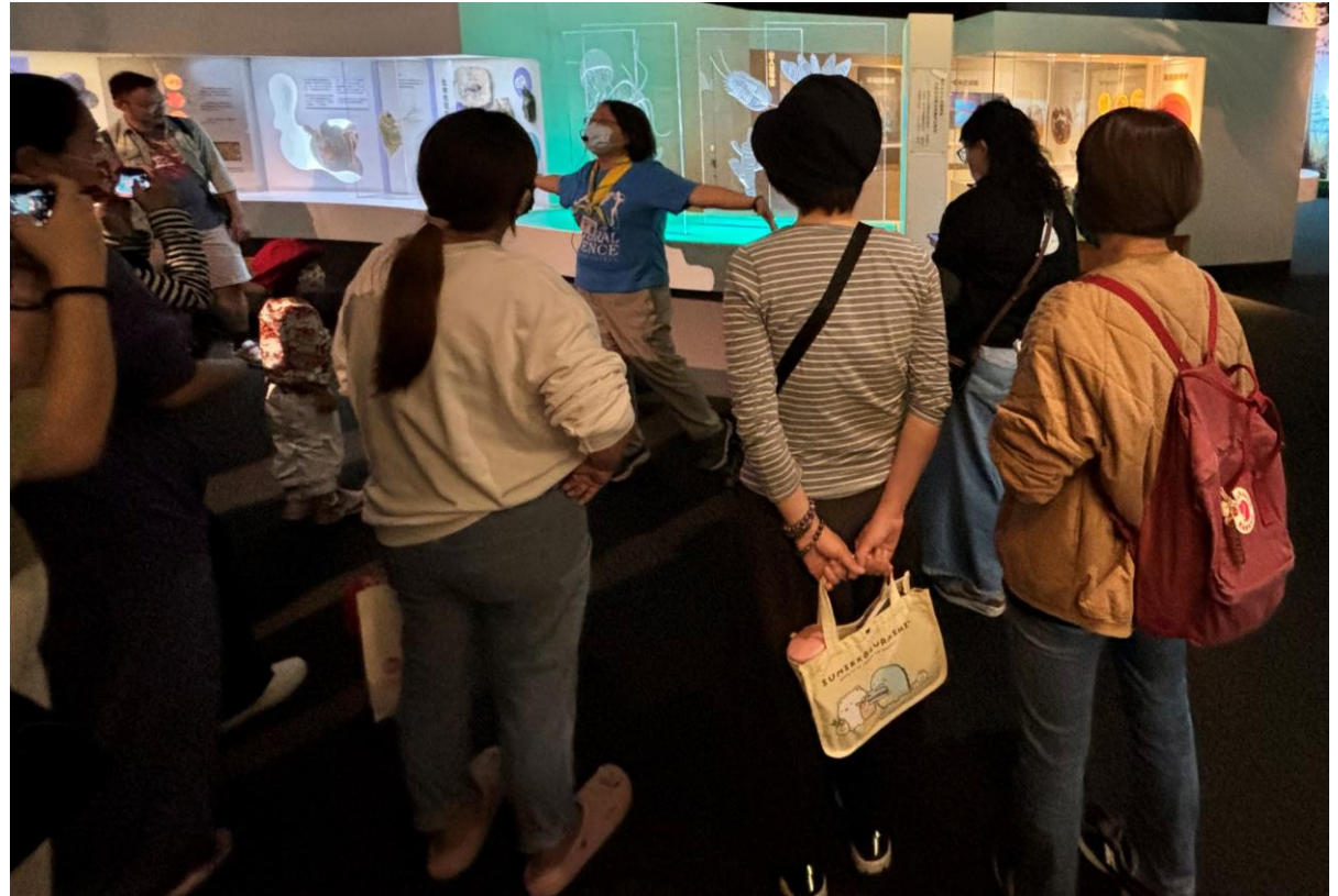
● 人類文明史：地球編年史之滄海一粟