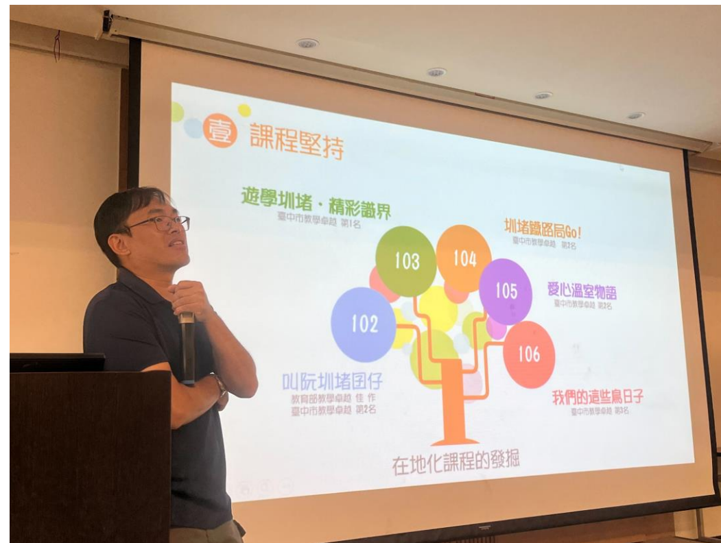
●教學卓越課程分享