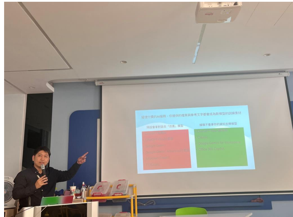
● 生成式AI工具優缺點分析